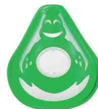
Dětská maska (od 2 let)