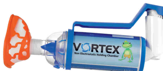
Vortex s MDI dávkovačem