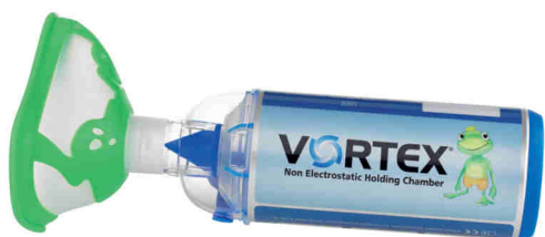
Vortex s maskou pro děti od 2 let

Pro všechny typy běžných aerosolových dávkovačů (MDI).