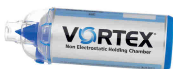
Vortex s náustkem