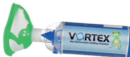
Vortex s maskou pro děti od 2 let