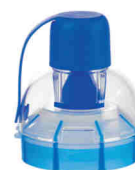
Vortex náhradní náustek