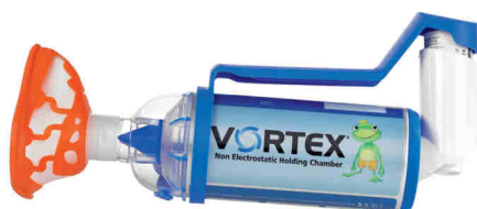
Vortex s maskou pro děti (0 - 2 roky)