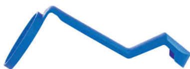
Vortex nástavec pro MDI dávkovač