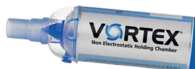
Vortex pro pacienty s tracheostomií