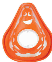
Dětská maska (0-2 roky)