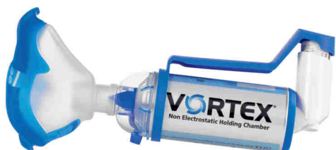
Vortex s náustkem pro dospělé