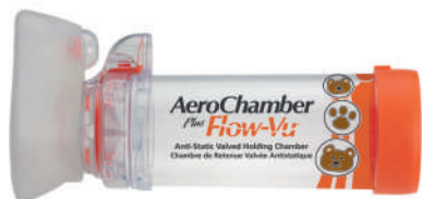
0 - 18 měsíců