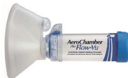
> 5 let