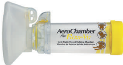
1 - 5 let