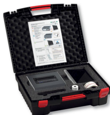
VenoScreen plus kompletní balení