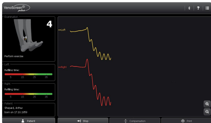
Cvičení pro vypumpování krve

Všechny produkty společnosti Medis, Medizinische Messtechnik GmbH jsou vyrobeny tak, aby splňovaly mezinárodní standardy a směrnice, které jsou vyžadovány.